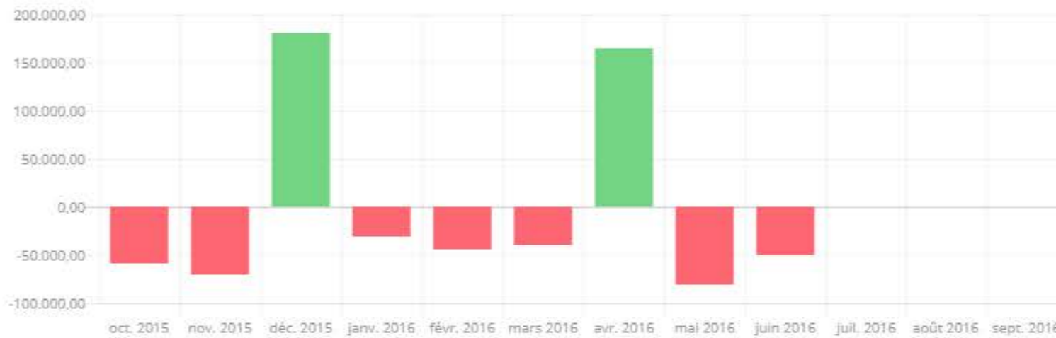
Résultat d'exploitation par période (en €)