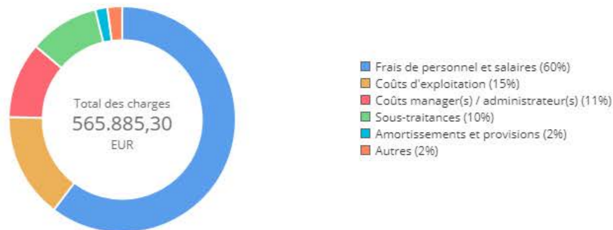
Répartition des coûts par catégories principales (en €)